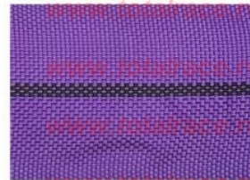
WLL Indicated by rows of stitching